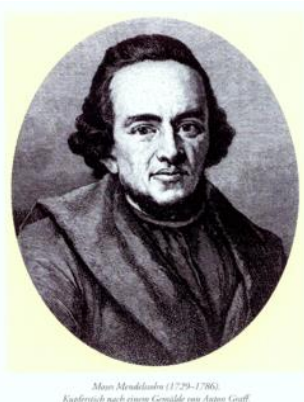
Moses Mendelssohn (1729-1786) Kopfrecht nach einem Gemälde von Anton Graff

Da sie wieder zu Hause war, schrieb ich ihr, und erkundigte mich, wieviel oder wenig Mendelssohn von Lessings religiösen Gesinnungen bekannt geworden wäre. – Lessing sei ein Spinozist gewesen. 3) Gegen mich hatte Lessing über diesen Gegenstand ohne alle Zurückhaltung sich geäußert; und da er überhaupt nicht geneigt war, seine Meinungen zu verhehlen, so durfte ich vermuten, was ich von ihm wusste, sei mehreren bekannt geworden. Dass er selbst aber gegen Mendelssohn sich hierüber nie deutlich erklärt hatte, dieses wurde mir auf folgende Weise bekannt.